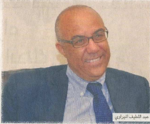
عبد اللطيف الميراوي

منحت جامعة العلوم الزراعية والطب البيطري ببوخارست برومانيا، لقب دكتوراه فخرية لرئيس جامعة القاضي عياض بمراكش، والرئيس الفخري للوكالة الجامعية للفرنكوفونية عبد اللطيف الميراوي. ويعتبر هذا اللقب الفخري، الذي قدم للميراوي خلال حفل أقيم نهاية الإسبوع الماضي برومانيا، من أرقى الجوائز وأرفع الأوسمة والتكريمات التي تسلمها جامعة العلوم الزراعية والطب البيطري ببوخارست للشخصيات المرموقة ذات مسار حافل بالإنجازات، والتي قدمت مساهمات في مجال خبرتها أو أثرت في محيطها العلمي والجامعي. وتم اختيار رئيس جامعة القاضي